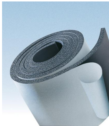
RIKAIADH : adhésif