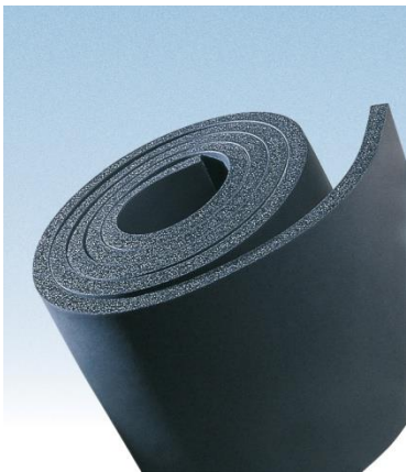
RIKAI : non adhésif